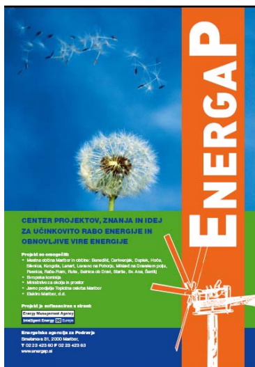
Predstavitveni plakat agencije

nalog, ki si jih je Energetska agencija za Podravje zastavila za cilj svojega delovanja. V letu 2007 smo se še posebej posvetili oblikovanju celostne grafične podobe naše agencije. Nalogo smo zaupali zunanjemu sodelavcu, ki je poskrbel za izdelavo novega logotipa in kombinacijo barv, ki se tako odraža v vsej poslovni dokumentaciji, s katero EnergaP nastopa v odnosu do strank (vizitke, kompliment krtice, kuverte, poslovne mape, dopisni listi, ...). Izdelali in oblikovali so plakate in stojala, ki nam bodo v pomoč pri izvajanju promocijskih in predstavitvenih aktivnosti. V jesenskih mesecih je celotna poslovno-stanovanjska stavba na Smetanovi 31 dobila nov fasadni omet, tako, da bomo lahko kmalu pred vhod EnergaP namestiti tudi vhodno tablo.