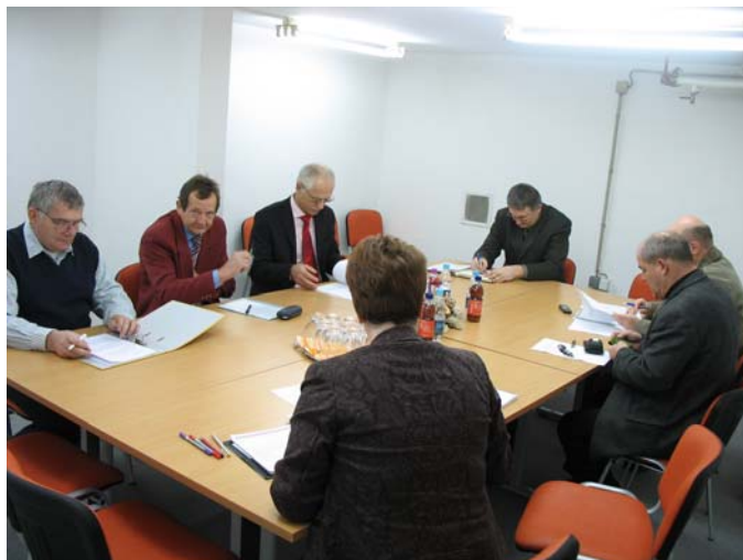
Seja Strokovnega sveta zavoda