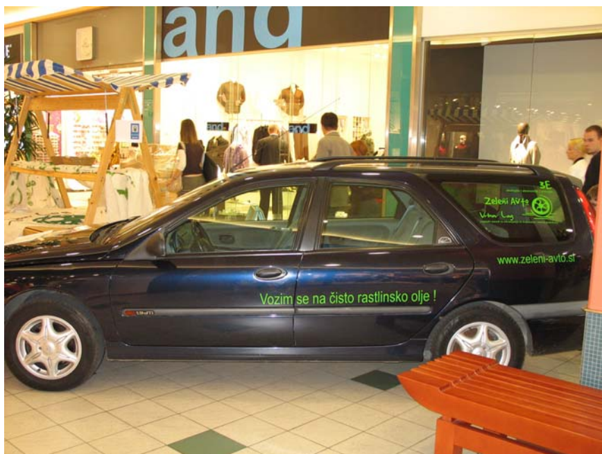
Alternativna goriva za avtomobile – rastlinsko olje

V okviru programa smo pričeli izvajati projekt MADEGASCAR in pripravili projektni predlog za promocijo javnega transporta. Projektni predlog bo sofinanciran v višini 75% tudi s strani Evropske komisije, v kolikor bo na razpisu uspešen.