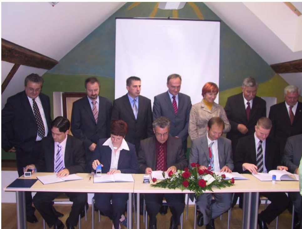
Podpis konzorcijske pogodbe lokalnih energetske agencij Slovenije, v prisotnosti ministra J. Podobnika in županov