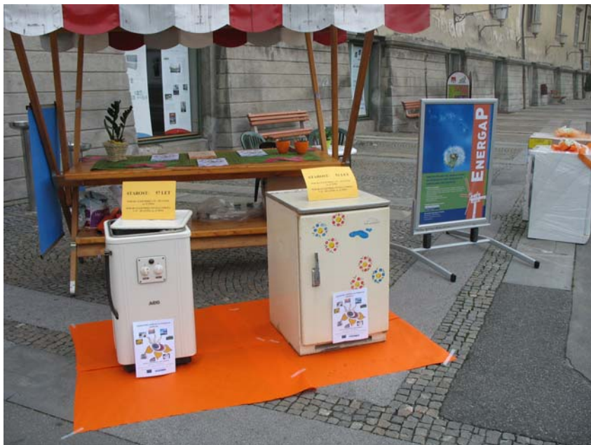
1. obletnica ustanovitve EnergaP – prireditev na Trgu Svobode

energije in nagradno igro, kjer smo skupaj z radiem City Maribor poiskali najstarejši, še delujoči pralni stroj in hladilnik, ki trošita zelo veliko energije, in ju zamenjali z novima, energetske zelo učinkovitima. Zamenjava aparatov je potekala na Trgu svobode, 7. junija 2007 ob 11. uri. Hkrati pa je na stojnici na Trgu svobode med 10. in 17. uro potekalo brezplačno svetovanje za občane in predstavitev naše agencije. V okviru akcije je potekal tudi radijski nagradni kviz na temo varčevanja z energijo. Nagrade so bile varčne žarnice. Izdali smo zloženko »Varčevanje z elektriko in denarjem brez odrekovanja udobja«, ki smo jo namenili gospodinjstvom oziroma širši javnosti.