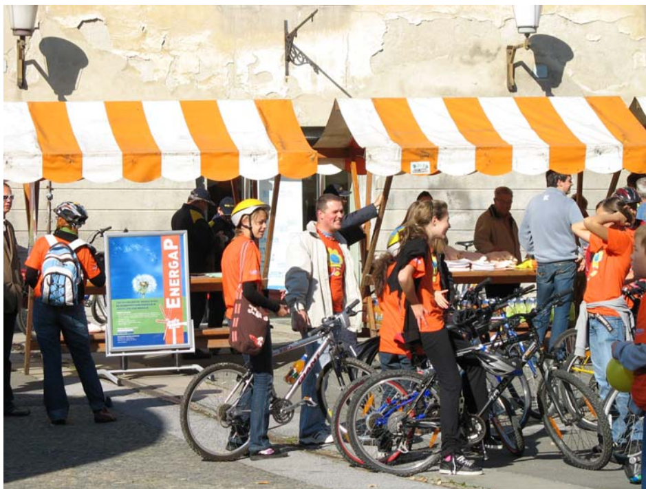
Prireditve ob tednu mobilnosti na Trgu svobode v Mariboru

Trgu svobode v Mariboru. Ob tej priložnosti smo pripravili letak, katerega namen je bil poučiti sodelujoče v prometu o varčni in okoljsko primernejši vožnji (eco-driving), v sodelovanju s Fakulteto za elektrotehniko, računalništvo in informatiko Univerze v Mariboru pa smo predstavili tudi kolo na električni pogon. Sodelovanje z nami je ob tej priložnosti ponudila avto hiša Toyota Arden, ki je ob naši stojnici predstavila hibridno vozilo Toyota Prius, ki deluje na principu kombinacije bencinskega in elektromotorja.