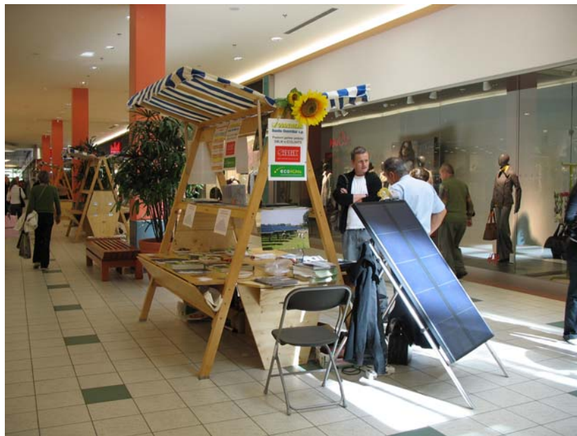
Predstavitev rabe obnovljivih virov energije in svetovanja ob tednu obnovljivih virov energije v Europarku v Mariboru

V četrtek, 20. septembra 2007 smo se odzvali vabilu Sveta za preventivo in vzgojo v cestnem prometu za sodelovanje pri izvedbi vzgojno preventivne akcije »Drugače na pot – v šolo s kolesom 2007« v okviru Tedna mobilnosti in predstavili svoje delovanje na stojnici na