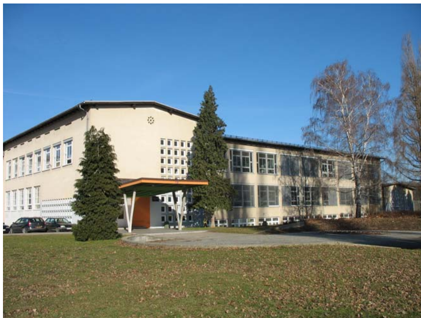
Energetski pregled OŠ Martina Konšaka Maribor

V letu 2007 smo v sodelovanju z Mestno občino Maribor izvedli natančen energetski pregled Osnovne šole Martina Konšaka v Mariboru ter namestili merilne naprave, ki nam bodo v pomoč pri pridobivanju informacij in podatkov o porabi energije. Uvajamo tudi energetsko knjigovodstvo. Izvedli smo energetski pregled ene srednje šole in pripravili možne ukrepe za URE. Za ostale javne stavbe smo pripravili informativno gradivo kako se izvede energetski pregled in osnove energetskega knjigovodstva. Pripravili smo baze podatkov o rabi toplotne in električne energije za javne stavbe v Mariboru. Pripravili smo tudi spletno gradivo o ukrepih za URE v šolah in pisarnah. V sodelovanju s Poslovno cono Tezno pripravljamo program za informiranje podjetij o URE, OVE in energetskih pregledih.