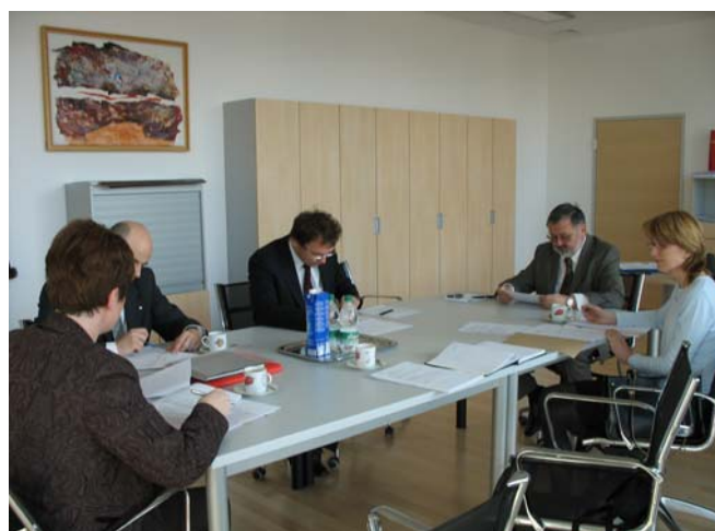
Seja Sveta zavoda