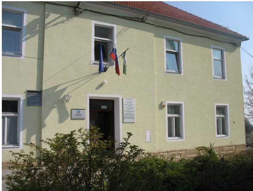
Obisk občine Sveta Ana