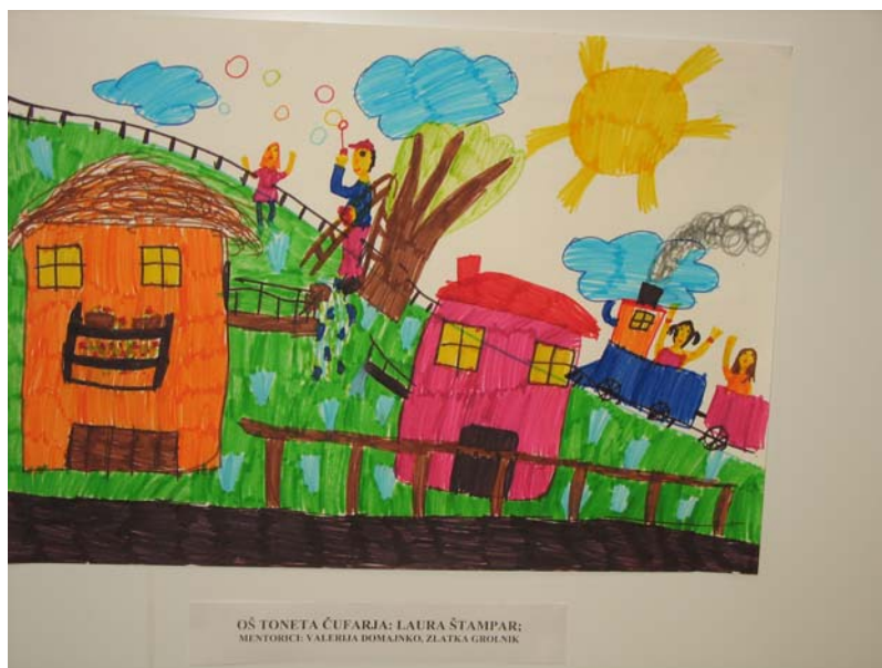
Razstava likovnih del učencev