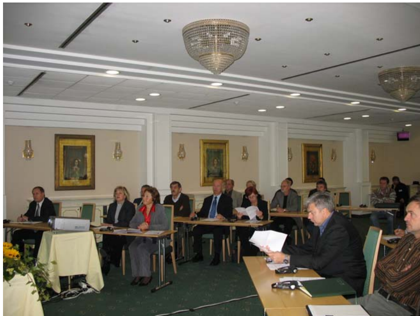
Delavnica na temo energetskih pregledov in energetskega knjigovodstva

V sodelovanju z Mestno občino Maribor smo organizirali dve delavnici na temo energetskih pregledov v stavbah in financiranje ukrepov URE. Predstavili smo tudi cilje kohezijskega sklada na področju Trajnostne rabe energije. Prve delavnice se je udeležilo 32 in druge 25 ljudi. Energetska agencija za Podravje je v letu 2007 sodelovala kot soorganizator 16. mednarodne konference Komunalna energetika in na posvetu tudi predstavila dva prispevka.