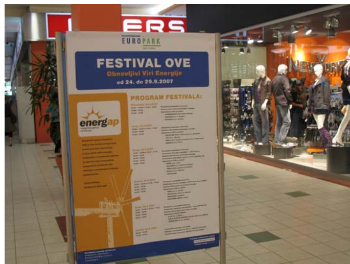
Teden obnovljivih virov energije v Europarku v Mariboru