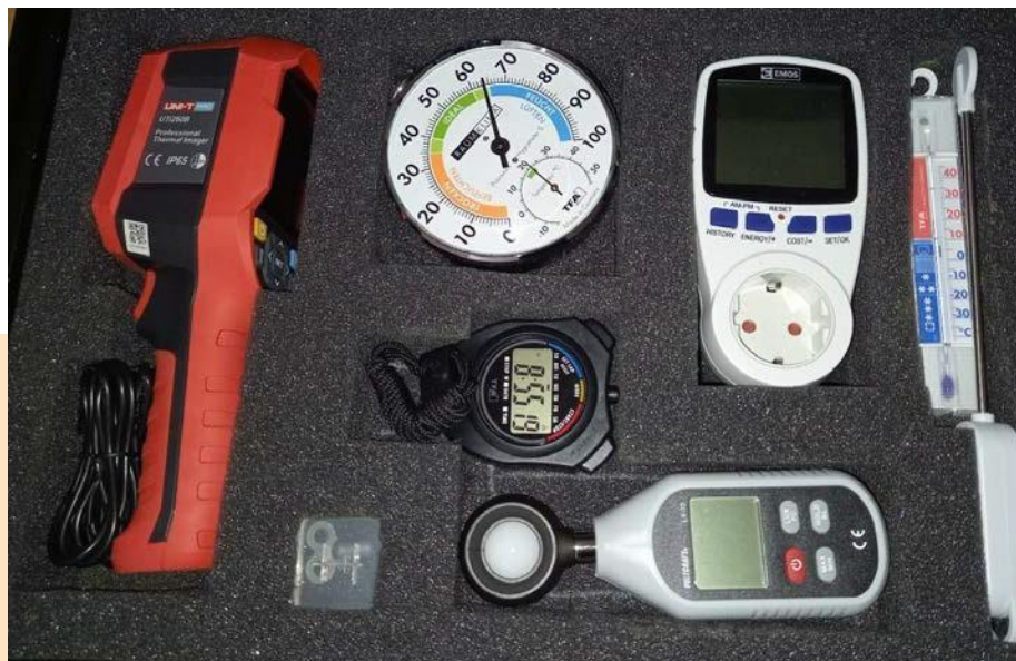
Energetski kovček za vključevanje prebivalcev v ukrepe znižanja ogljičnega odtisa

V regionalnem akcijskem načrtu se je Energap osredotočil predvsem na 5. delovno aktivnost. Ta je informiranje in sodelovanje s prebivalci. Skozi aktivnosti, ki so zapisane v RAP-u, so se določile metode in orodja za aktivno sodelovanje različnih ciljnih skupin prebivalcev pri načrtovanju in izvajanju različnih ukrepov. Rezultati bodo vključevali ICT tehnologijo in instrumente, kot tudi nekaj osnovnih osebnih ukrepov, h katerim se bodo prebivalci zavezali.